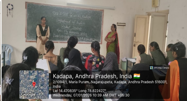
Kadapa, Andhra Pradesh, India 2/1094/1, Maria Puram, Nagarajupeta, Kadapa, Andhra Pradesh 516001, India Lat 14.470835° Long 78.822427° Wednesday, 07/01/2026 10:39 AM GMT +05:30