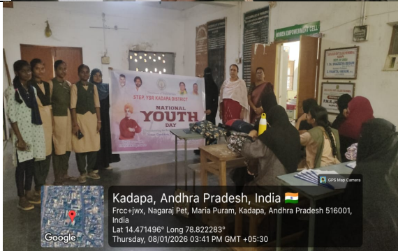
Kadapa, Andhra Pradesh, India Frcc+jwx, Nagaraj Pet, Maria Puram, Kadapa, Andhra Pradesh 516001, India Lat 14.471496° Long 78.822283° Thursday, 08/01/2026 03:41 PM GMT +05:30