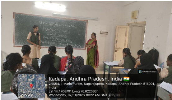
Kadapa, Andhra Pradesh, India 2/1094/1, Maria Puram, Nagarajupeta, Kadapa, Andhra Pradesh 516001, India Lat 14.470879° Long 78.822383° Wednesday, 07/01/2026 10:22 AM GMT +05:30