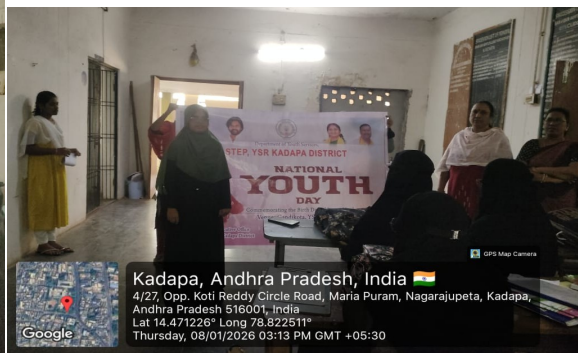
Kadapa, Andhra Pradesh, India 4/27, Opp. Koti Reddy Circle Road, Maria Puram, Nagarajupeta, Kadapa, Andhra Pradesh 516001, India Lat 14.471922° Long 78.822511° Thursday, 08/01/2026 03:13 PM GMT +05:30