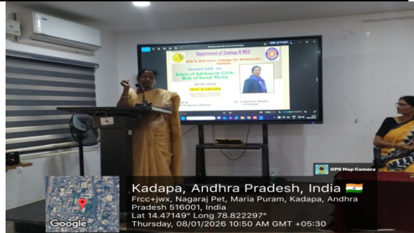
Kadapa, Andhra Pradesh, India Frcc+jwx, Nagaraj Pet, Maria Puram, Kadapa, Andhra Pradesh 516001, India Lat 14.47149° Long 78.822297° Thursday, 08/01/2026 10:50 AM GMT +05:30