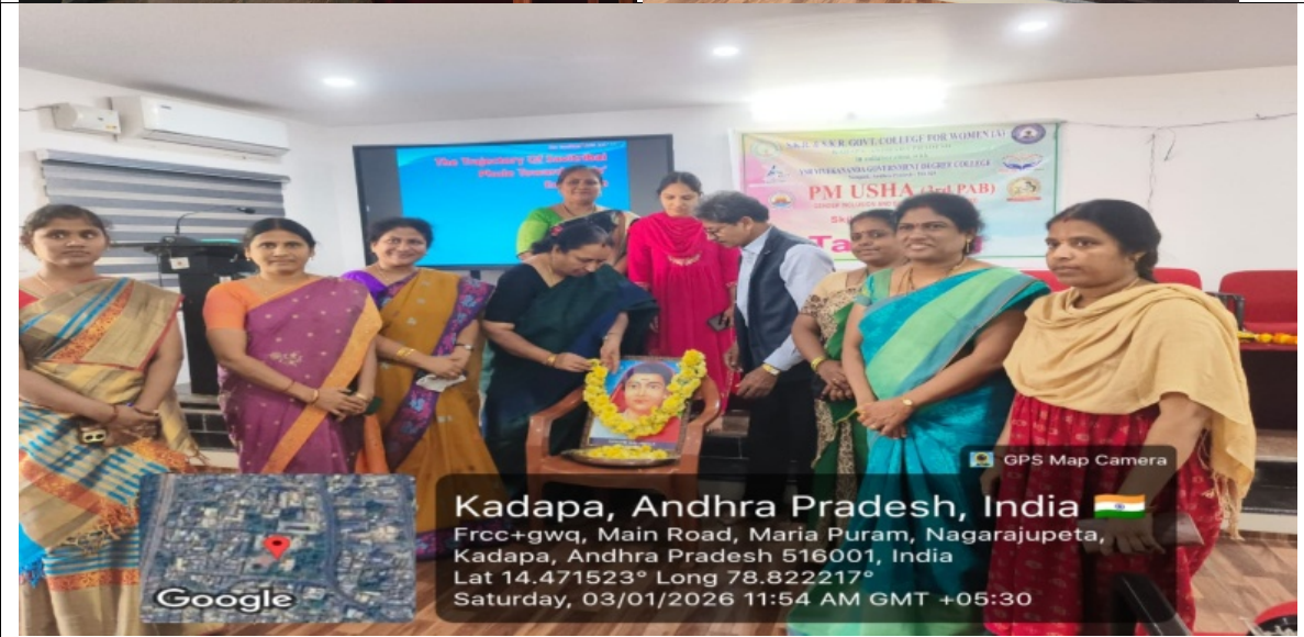
SAVITRI BAI POOLE BIRTH ANNIVERSARY ON 03-01-2026