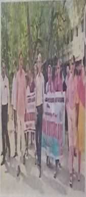
స్థానిక నిర్వహణ కమిటీ సభ్యులు, అధ్యక్షులు, విద్యార్థులు

ఈ కుటుంబ సంక్షేమ కార్యక్రమం డిటు హాక్కు సద్వినియోగం చేసుకోవాలి అనే అంశంపై ప్రజలకు అవగాహన కల్పించే లక్ష్యంతో ఈ కార్యక్రమం నిర్వహించబడుతుంది. ఈ కార్యక్రమంలో పాల్గొన్న వారు డిటు హాక్కు సద్వినియోగం చేసుకోవాలి అనే అంశంపై ప్రజలకు అవగాహన కల్పించే లక్ష్యంతో ఈ కార్యక్రమం నిర్వహించబడుతుంది. ఈ కార్యక్రమంలో పాల్గొన్న వారు డిటు హాక్కు సద్వినియోగం చేసుకోవాలి అనే అంశంపై ప్రజలకు అవగాహన కల్పించే లక్ష్యంతో ఈ కార్యక్రమం నిర్వహించబడుతుంది.