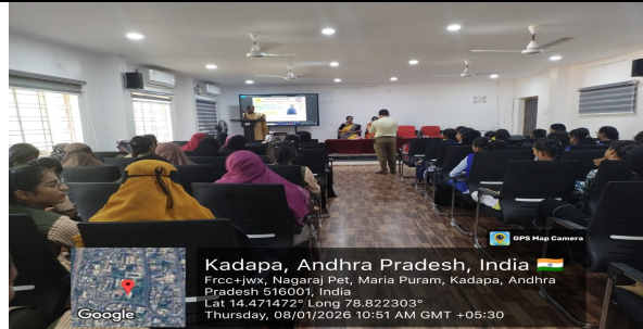
Kadapa, Andhra Pradesh, India Frcc+jwx, Nagaraj Pet, Maria Puram, Kadapa, Andhra Pradesh 516001, India Lat 14.471472° Long 78.822303° Thursday, 08/01/2026 10:51 AM GMT +05:30