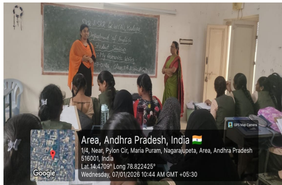
Area, Andhra Pradesh, India 1/4, Near Pylon Cir, Maria Puram, Nagarajupeta, Area, Andhra Pradesh 516001, India Lat 14.4709° Long 78.822425° Wednesday, 07/01/2026 10:44 AM GMT +05:30