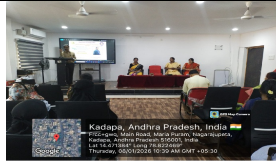
Kadapa, Andhra Pradesh, India Frcc+gwq, Main Road, Maria Puram, Nagarajupeta, Kadapa, Andhra Pradesh 516001, India Lat 14.471384° Long 78.822468° Thursday, 08/01/2026 10:39 AM GMT +05:30