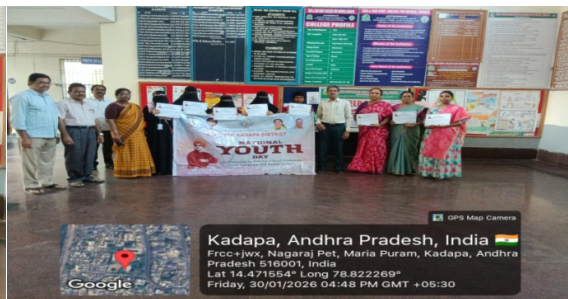
Kadapa, Andhra Pradesh, India Frcc+jwx, Nagaraj Pet, Maria Puram, Kadapa, Andhra Pradesh 516001, India Lat 14.471564° Long 78.822269° Friday, 30/01/2026 04:48 PM GMT +05:30