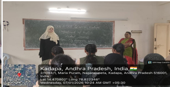
Kadapa, Andhra Pradesh, India 2/1094/1, Maria Puram, Nagarajupeta, Kadapa, Andhra Pradesh 516001, India Lat 14.470802° Long 78.822346° Wednesday, 07/01/2026 10:24 AM GMT +05:30